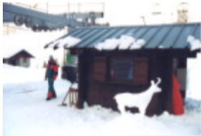
Photographie prise par un touriste

Mais ces pièces à conviction perdent en partie leur nécessité, et deviennent même superfétatoires, lorsque le corps humain porte sur lui, en lui, les qualités qu'elles attestent. Le corps distingue, mieux que tout le reste.